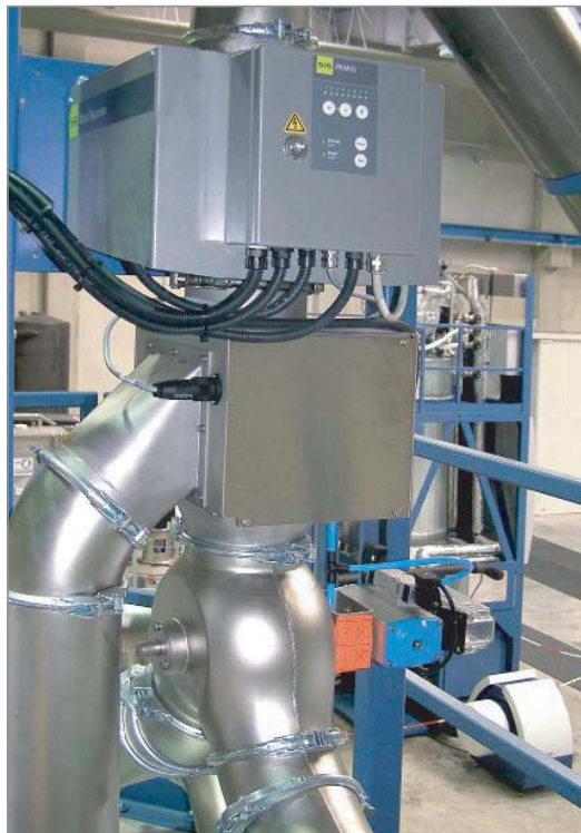
PET再生ラインの品質管理に使用されるRAPID VARIO-FS