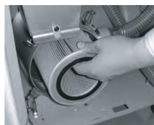
集塵フィルタ清掃