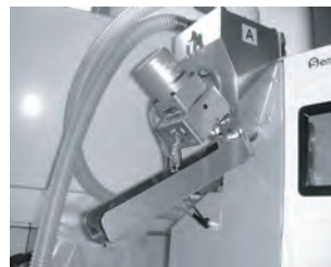
ホッパー内原料抜き取り