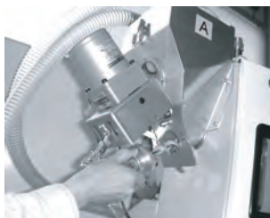
スクリーフィーダ抜き取り